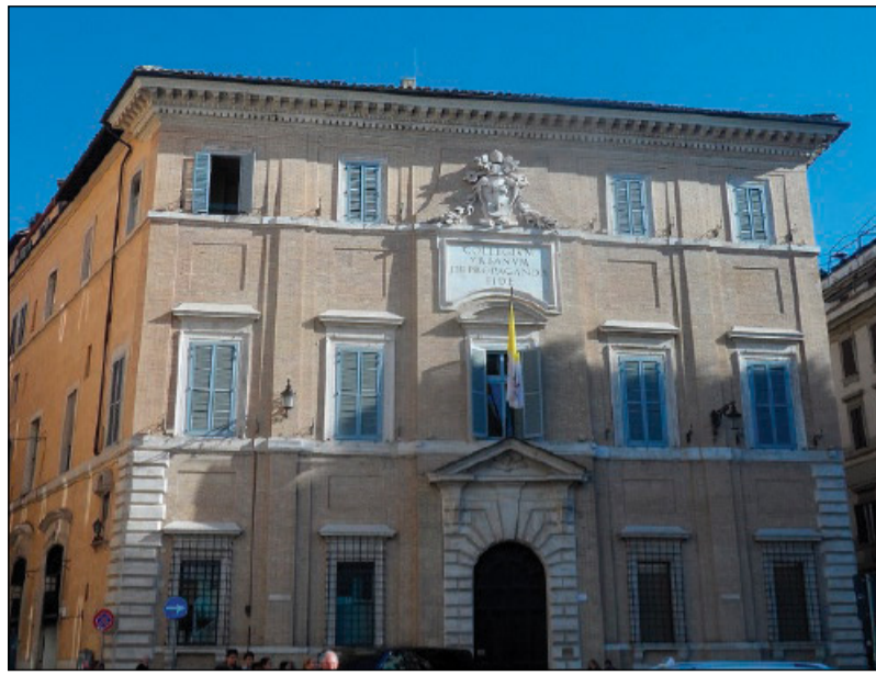
Il Palazzo di Propaganda Fide a Roma

Fin dalla sua nascita, Propaganda (questo il nome con il quale la Congregazione divenne presto nota) si poneva l'ambizioso obiettivo di tradurre in pratica il principio dell'universalismo pontificio, attraverso l'organizzazione dell'evangelizzazione, la fon-