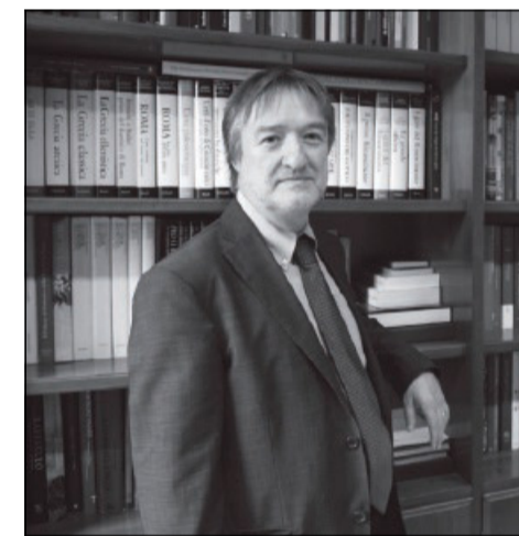
Per 35 anni ai Musei Vaticani

La sua passione musicale era nota, e ripeteva spesso la frase di Platone: «La musica è la migliore medicina dell'anima». Credo che tutti noi ascolteremo tanta musica da oggi in poi per provare a curare un poco la nostra anima scossa dalla tua partenza da noi. Ma sono soprattutto le parole di sant'Agostino che ci aiuteranno perché in linea con il suo garbo: «Perché dovrei essere fuori dai tuoi pensieri e dalla tua mente, solo perché sono fuori dalla tua vista? Non sono lontano, sono dall'altra parte, proprio dietro l'angolo. Rassicurati, va tutto bene».