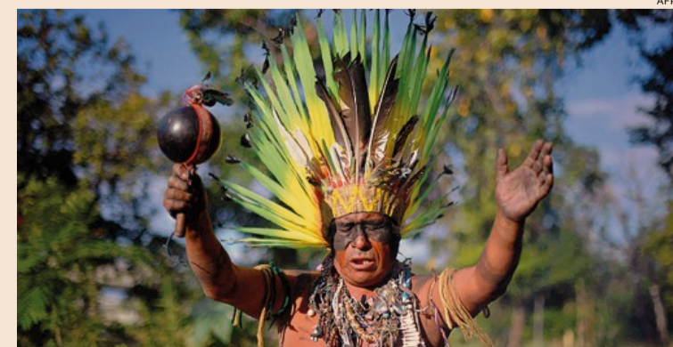
Rituali. Un indigeno Korùbo durante un rito

Maurizio Leighb La Bussola, pagg. 340, € 30 In questo articolo l'autore presenta i temi del libro