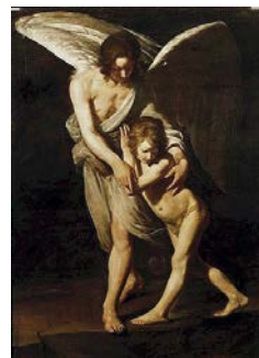
25. Andrea Sacchi, L'Angelo custode , Rieti, Duomo.