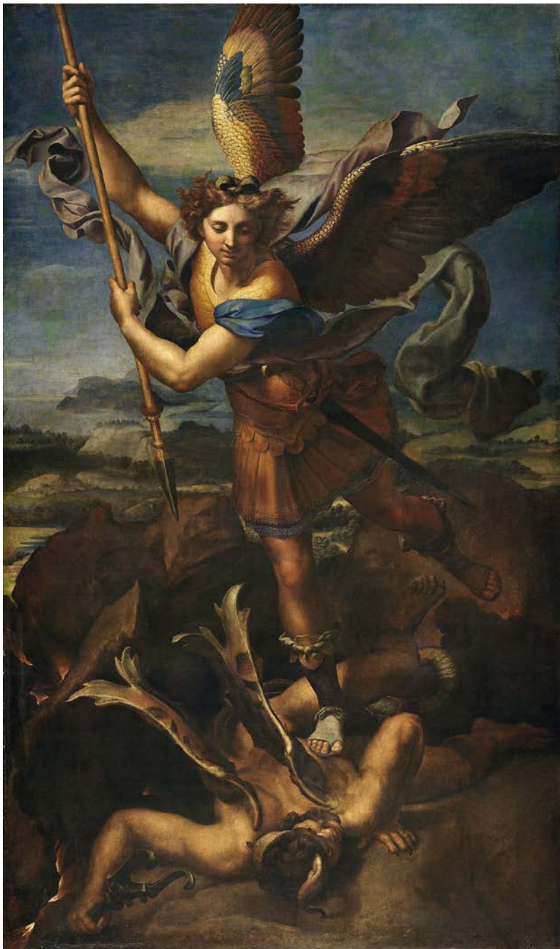
15. Raffaello Sanzio, San Michele Arcangelo , Parigi, Louvre.