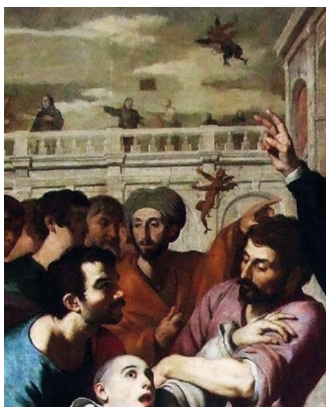
13. Francesco Guarino, San Benedetto che esorcizza un frate ossesso , Campobasso, Chiesa di Sant'Antonio Abate.