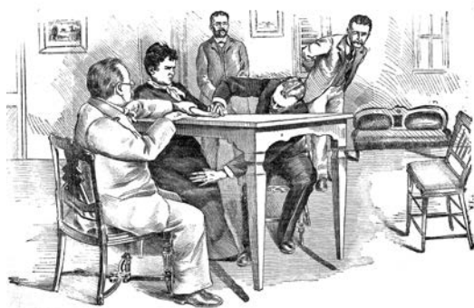
Fig. 4. Disegno che raffigura Lombroso e Richet, controllori di Eusapia, nel 1892.

momento era forse lo scienziato italiano più visibile al mondo aveva dunque ceduto. L'Ercole napoletano poteva quindi cantar vittoria.