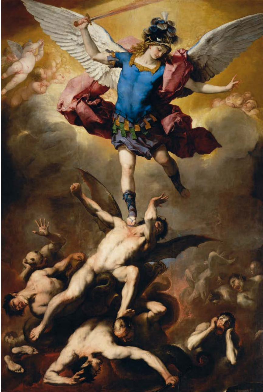
19. Luca Giordano, San Michele Arcangelo , Vienna, Kunsthistorisches Museum.