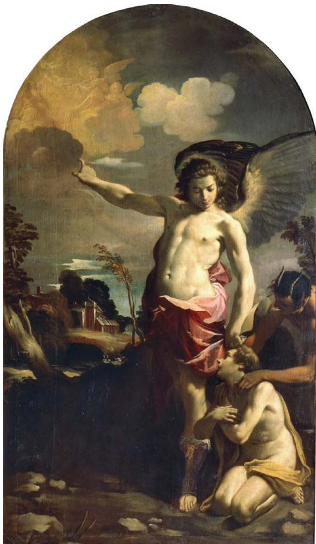
24. Carlo Bononi, L'Angelo custode , Modena, Galleria Estense.