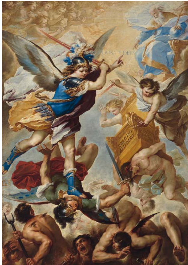
7. Tomba di Elio Callistio, detta anche Sedia del Diavolo, Roma, Quartiere Trieste, II secolo d.C.