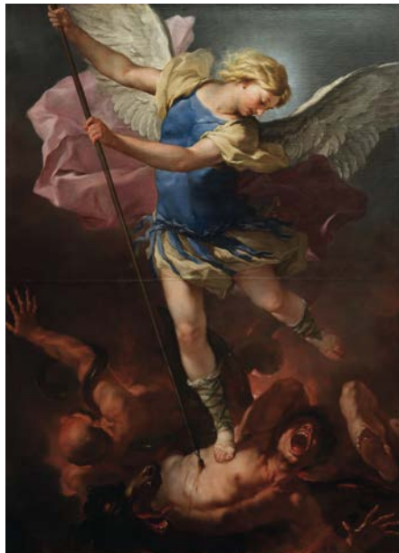
17. Guido Reni, San Michele Arcangelo , Roma, Chiesa di Santa Maria della Concezione dei Cappuccini.