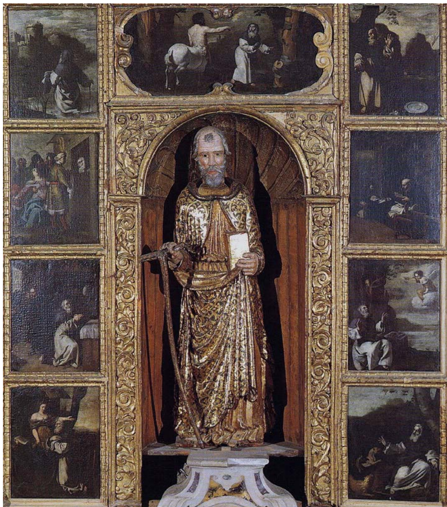
12. Scultore meridionale della fine del XV secolo, Statua di Sant'Antonio Abate , e Francesco Guarino, Storie di Sant'Antonio Abate , Campobasso, Chiesa di Sant'Antonio Abate.