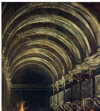
29. Jacopo Robusti, detto il Tintoretto, Il Ritrovamento del corpo di San Marco , Milano, Pinacoteca di Brera.