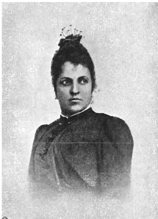
Fig. 3. Ritratto di Eusapia Palladino risalente al 1872 circa. Tratto da P. Lombroso, Eusapia Palladino. Cenni Biografici , 1907.

diveniva per gli occultisti d'Europa una specie di indemoniata: un'ossessa vessata da una masnada di agenti occulti demoniaci che non riuscivano a trovare requie neanche nell'aldilà 29 .