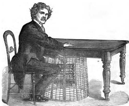
Fig. 2. Disegno che raffigura il medium Home durante gli esperimenti di William Crookes. Tratto da W. Crookes, Researches in the Phenomena of Spiritualism , 1874.

Ma il contributo del signor Damiani allo spiritismo partenopeo si spinse ancora oltre. Essendo egli vissuto a lungo in Inghilterra, dove aveva lavorato come faccendiere o, stando a certe voci, come diplomatico italiano presso il governo della regina Vittoria, era entrato precocemente in contatto con la Dialectical Society di Londra e per tutta la sua vita aveva mantenuto contatti con i circoli spiritici e le numerose riviste di settore della capitale inglese 19 . Grazie a lui si erano ulteriormente consolidati i rapporti tra i circoli spiritici di Napoli e quelli di Londra, dove il fisico e chimico William Crookes aveva condotto le prime investigazioni scientifiche sugli psychical phenomena sedendo al tavolo di medium come Daniel Dunglas Home 20 .