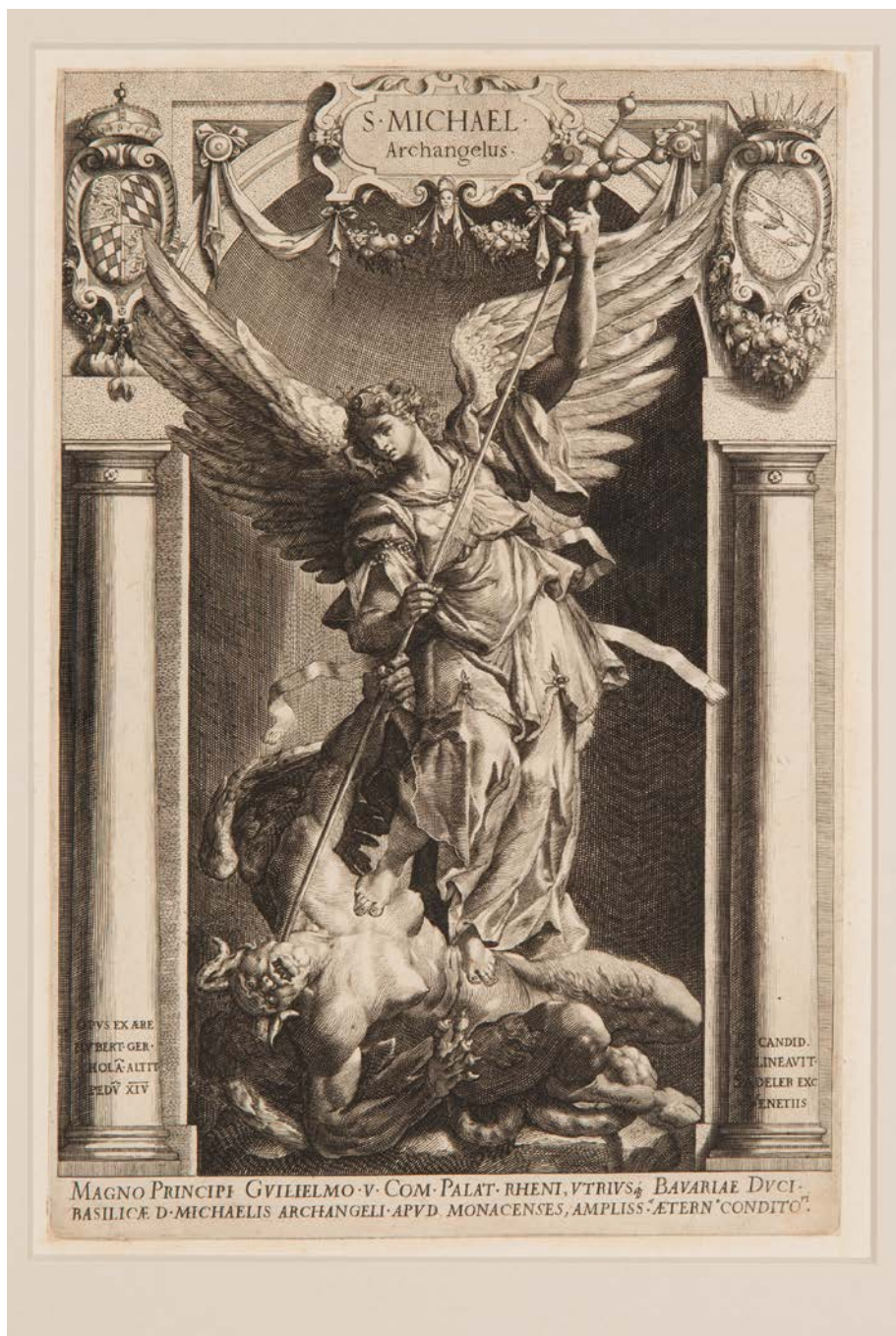
16. Lucas Kilian da Peter de Witte, detto Pietro Candido, San Michele Arcangelo , incisione.