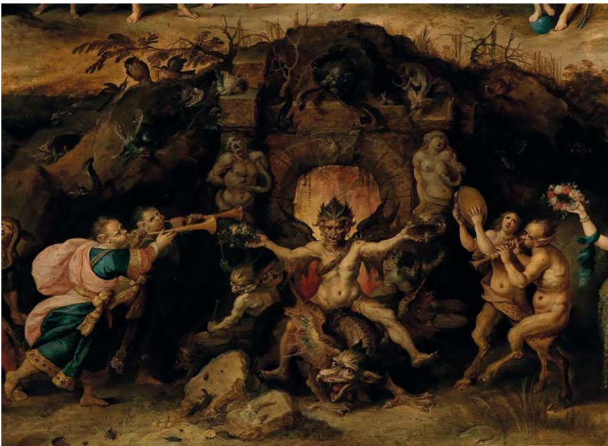
5. Frans Francken II, Allegoria del dilemma umano tra la scelta della virtù e quella del vizio , Boston, Museum of Fine Arts.